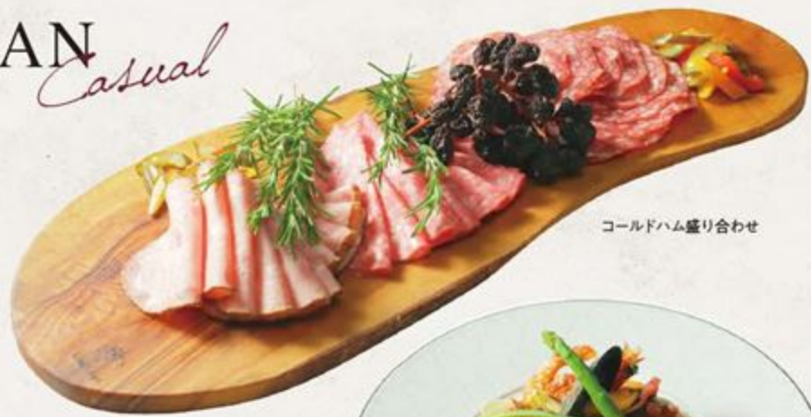
コールドハム盛り合わせ