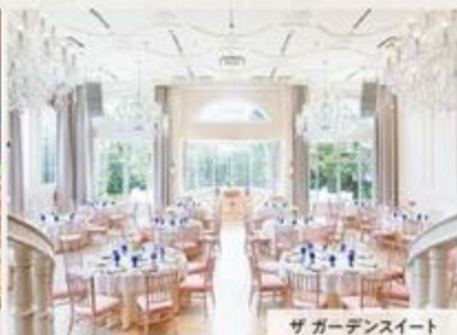
ザガーデンスイート