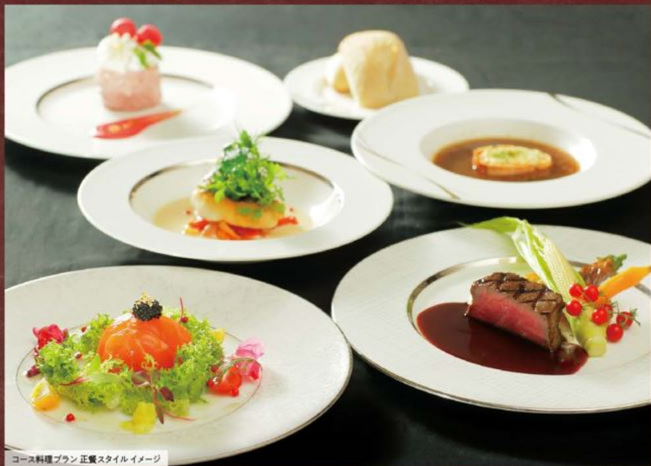
コース料理プラン 正餐スタイルイメージ