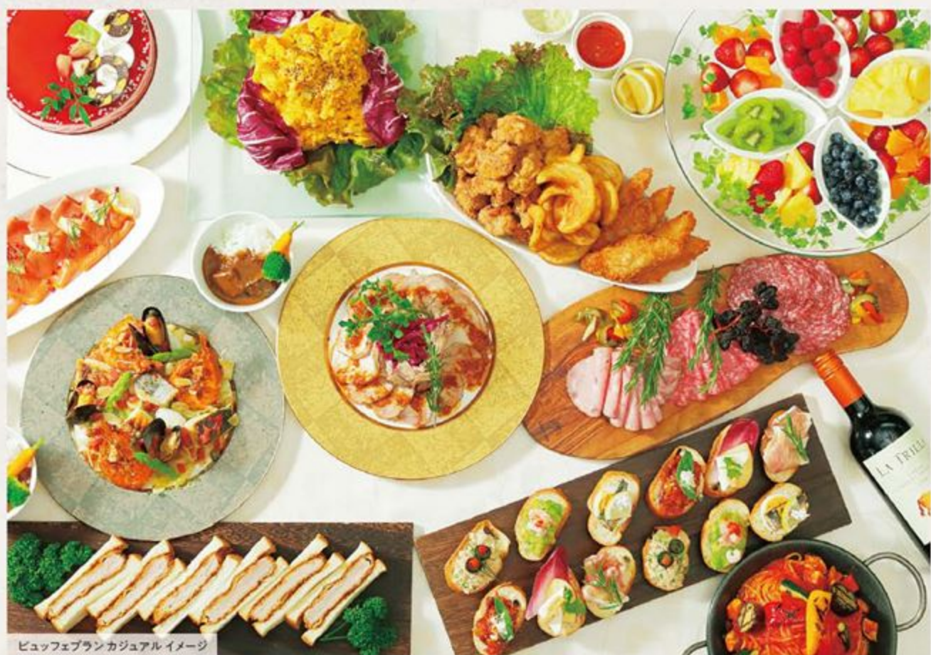
ビュッフェブランカジュアルイメージ