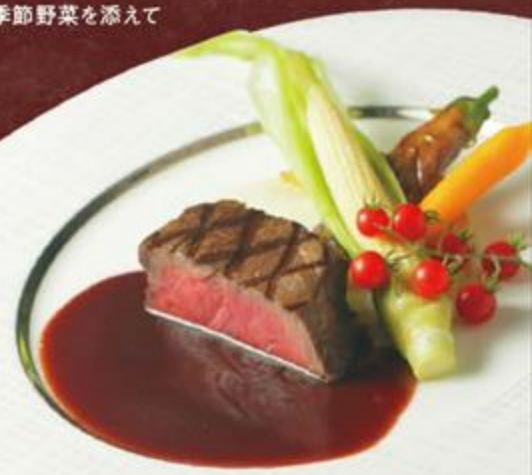
国産牛ヒレ肉のグリル 熟成赤ワインソース クリーミーなマッシュポテトと季節野菜を添えて