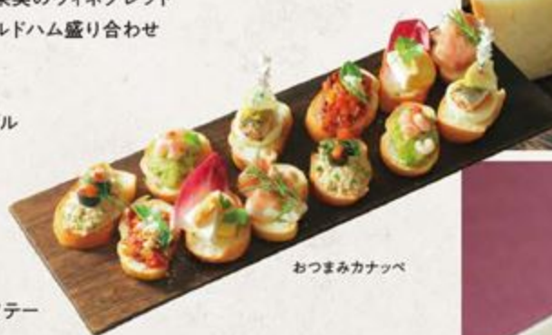
おつまみカナッペ