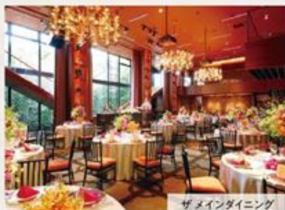
ザメインダイニング