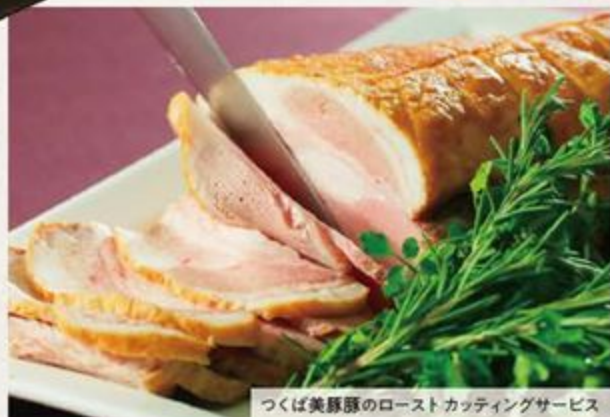
つくば美豚豚のロースト Cuttingサービス