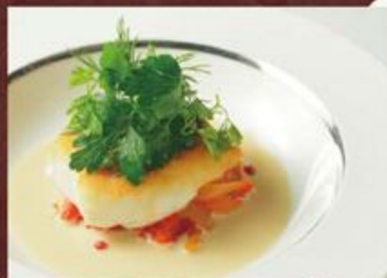
活丹真鯛のボワレ 2色のパプリカのピペラード とともに ノイリー酒香る白ワインソースで