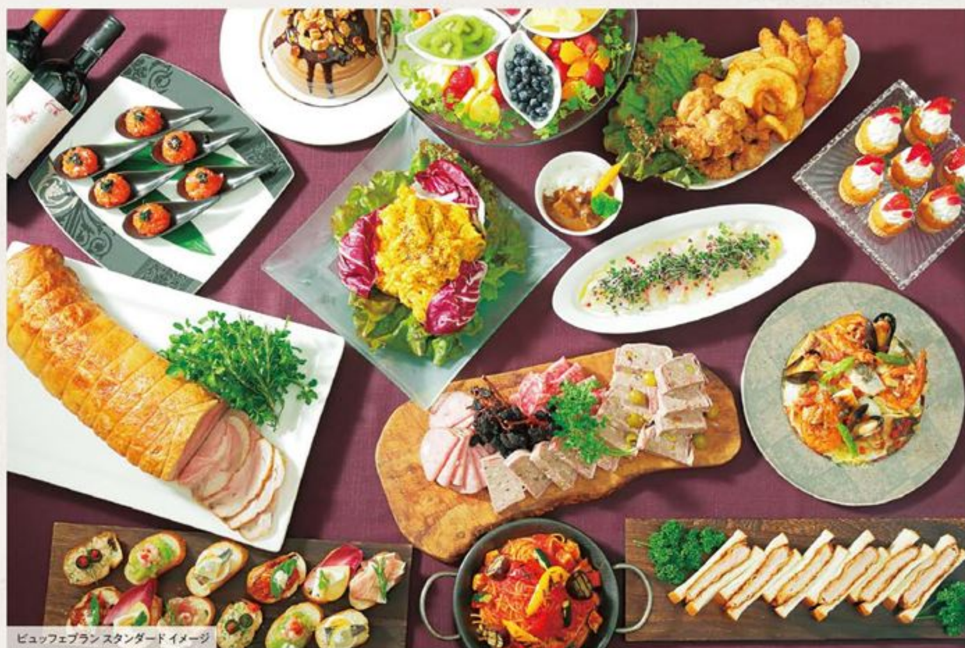
ビュッフェプランスタンダードイメージ