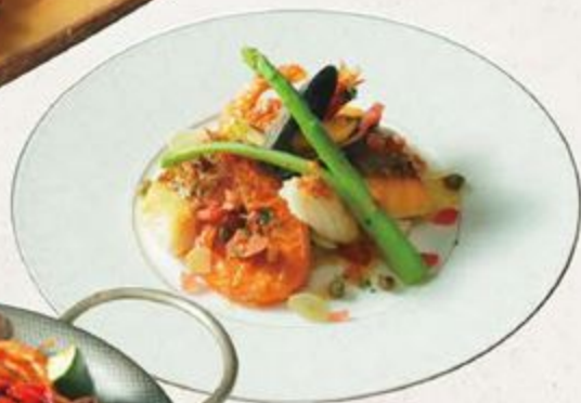
フィッシュとシーフードのソテー ブルノアゼットソース